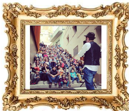
Festival Encontats de Balaguer, 2016