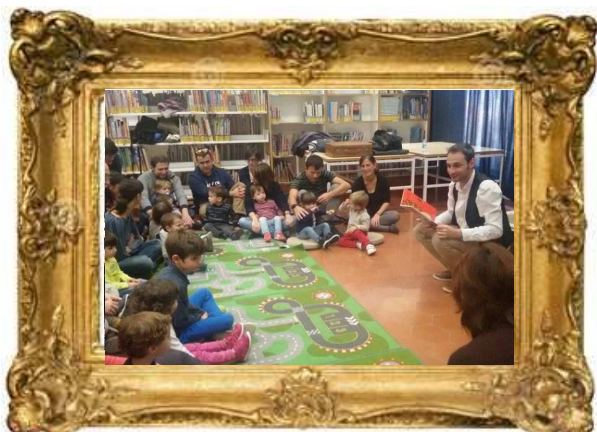
Biblioteca de Vilafranca del Penedès, 2015