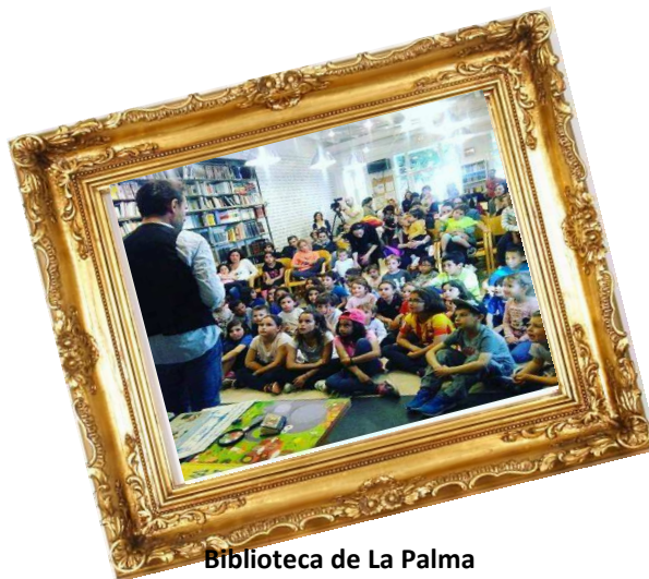
Biblioteca de La Palma De Cervelló, 2017