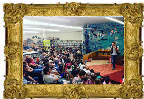
Biblioteca Central de Santa Coloma de Gramenet, 2016