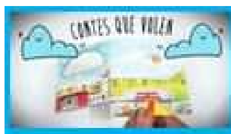
Vídeo promocional de l'espectacle*

*Material disponible a www.joandeboer.cat apartat NARRACIÓ ORAL