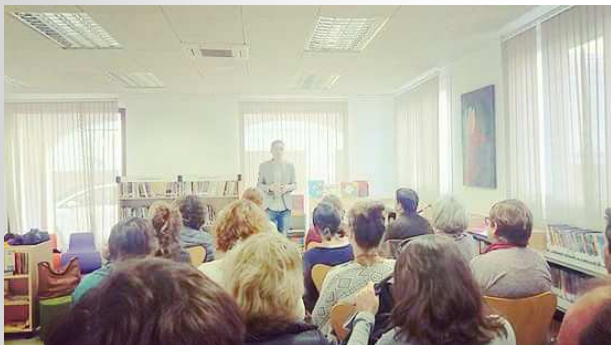
“L’Hora del Conte: les claus de l’èxit” Jornades de Formació biblioteques de Menorca, Nov. 2016