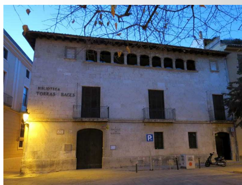
“L’Hora del Conte: les claus de l’èxit” Trobada biblioteques Penedès/Garraf, Mar. 2015