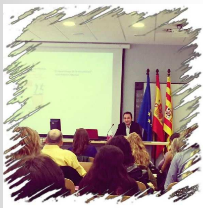
“Escriptura creativa a l’aula” Jornades de Formació al CAREI de Saragossa , Mar. 2015